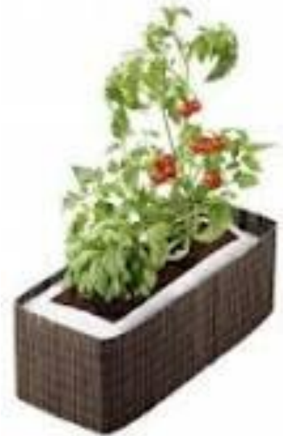
En jardinière (semis de radis, plants de salades, rempotage des pois)