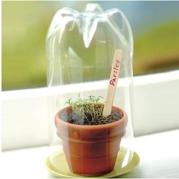
La serre en bouteille (semis de petits pois)