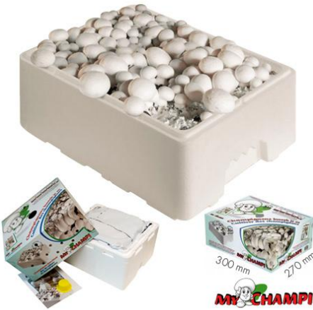
La culture des champignons