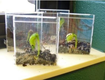
La germination du pois