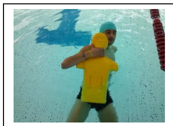
Prise au cou