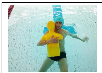
Main sur poitrine