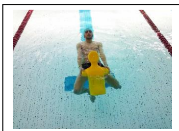
Mains aux 2 moignons