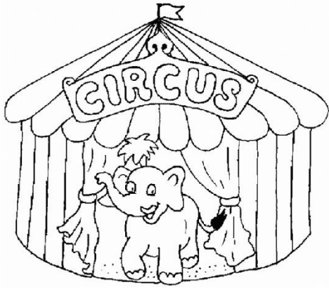
le cirque - le cirque