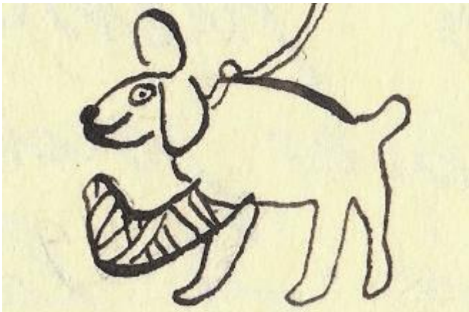
Il a une patte cassée.