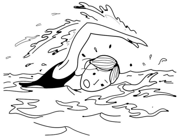
Elle nage. - Elle nage.

A lire - à lire : que - qui - quoi - quai - presque quand - pourquoi - parce que - qu'il - qu'elle - qu'un un - se - plus - on - que - qui - te - en un cirque - il fabriquait - lorsque - qui - que