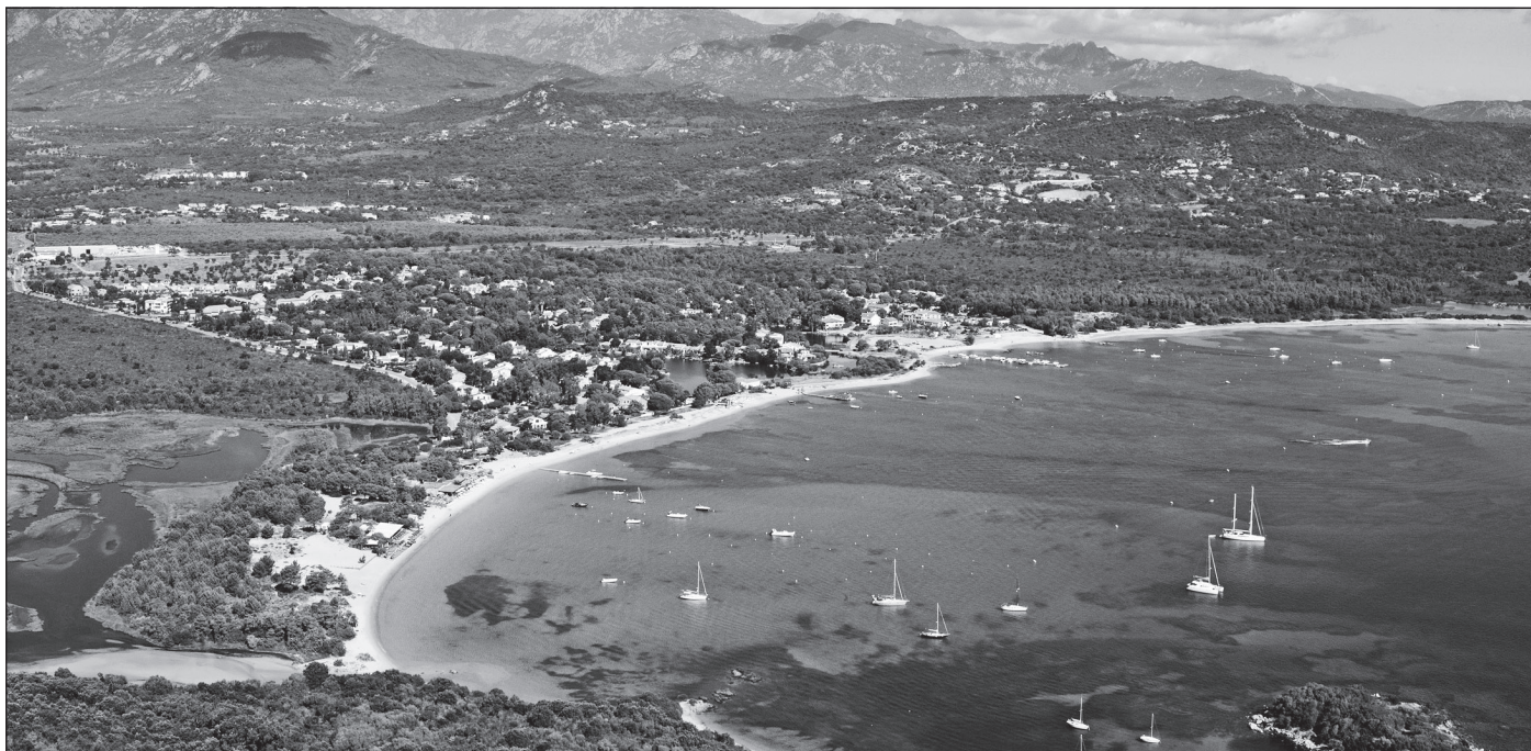
Doc. 1 Le littoral corse.

J'observe la fréquentation touristique en Corse.