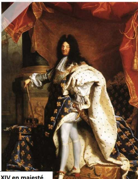
Louis XIV en majesté, tableau de Hyacinthe Rigaud, 1701

A l'aide de la carte et du texte, que peux-tu dire sur les guerres de Louis XIV ?