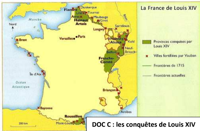
DOC C : les conquêtes de Louis XIV

DOC E : Lettre de Fénelon à Louis XIV (1694) : « Cependant vos peuples, que vous devriez aimer comme vos enfants, et qui ont été jusqu'ici passionnés par vous, meurent de faim. La culture des terres est presque abandonnée, les villes et les campagnes se dépeuplent. Au lieu de tirer de l'argent de ce pauvre peuple, il faudrait lui faire l'aumône et le nourrir. Le peuple même (il faut tout dire), qui vous a tant aimé, qui a tant eu confiance en vous, commence à perdre l'amitié, la confiance et même le respect. Vos victoires et vos conquêtes ne le réjouissent plus ; il est plein d'aigreur et de désespoir. La sédition s'allume peu à peu de toutes parts. »