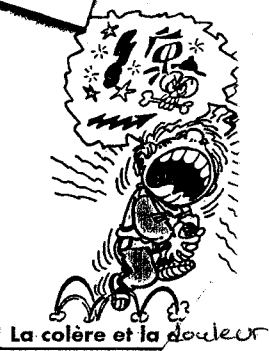
La colère et la douleur

Comment dessinerais-tu en une icône le chant d'un personnage ? Les icônes sont très utilisées dans les lieux publics, trouve quelques exemples !