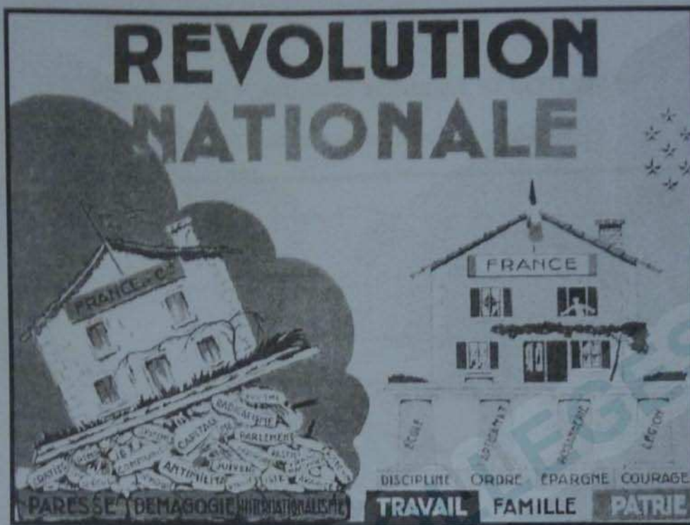
Document 3 - Affiche vichyssoise (sans date, entre 1940 et 1942)