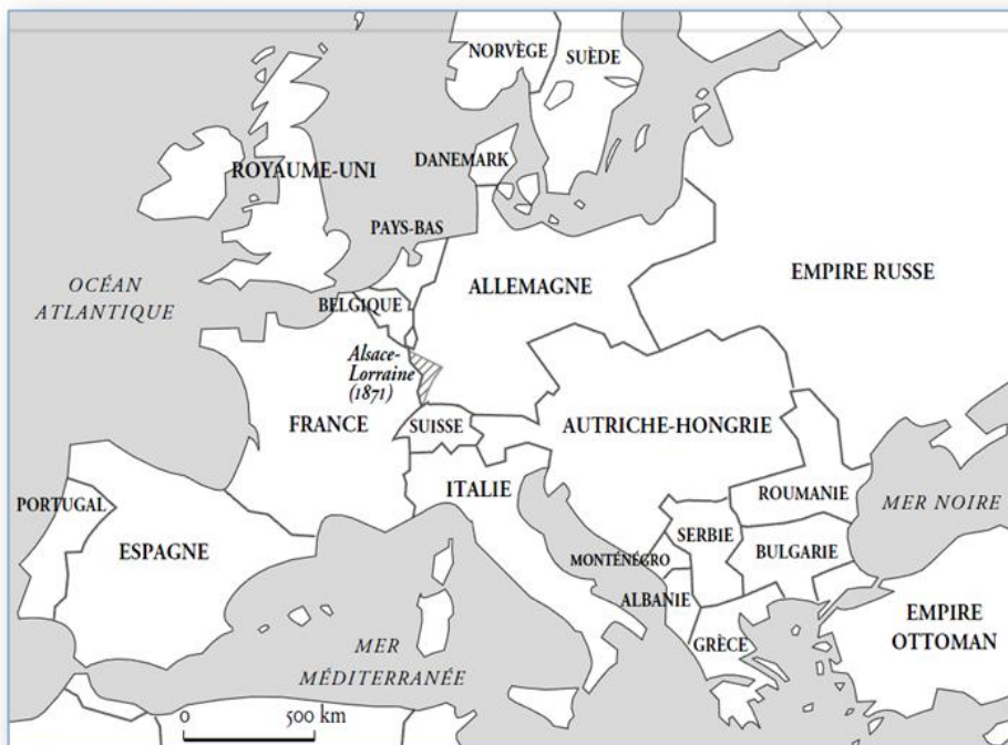
Carte : L'Europe en 1914