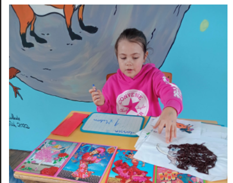
Yuna = Dessins coloriés et décorés