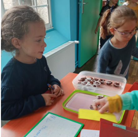
Selma = Mini brownies