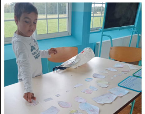
Teedjy = Dessins de manga