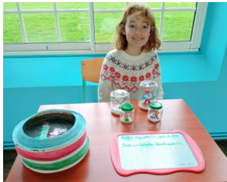
Mona = Boules à neige