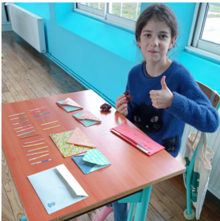
Alana = Poupées à tracas