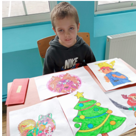
Victor = Coloriages