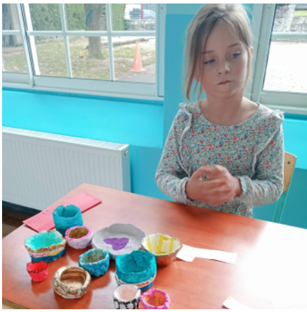
Zoé = Poterie