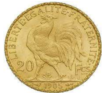
Image : 6 Une pièce d'or