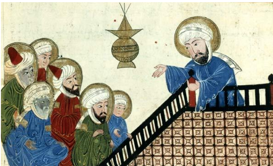
Mahomet prêchant la parole d'Allah, XVIIe