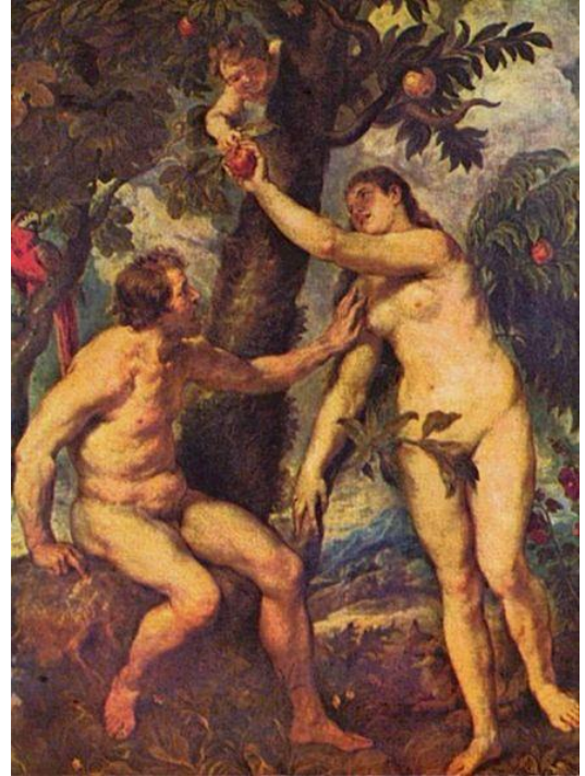
Adam et Ève, par Rubens, XVIIe