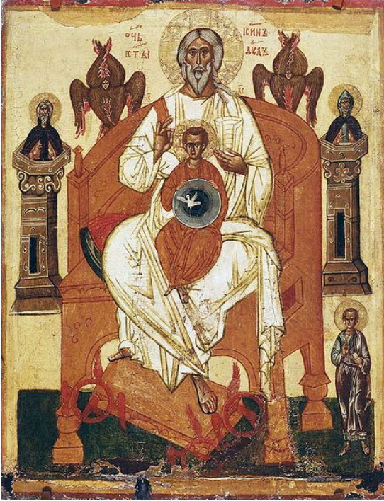
La Sainte Trinité. Icône russe du XIVe siècle