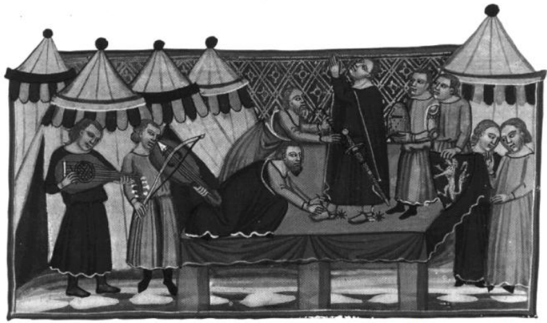
Miniature du roman de Troie, XIV e s. BnF