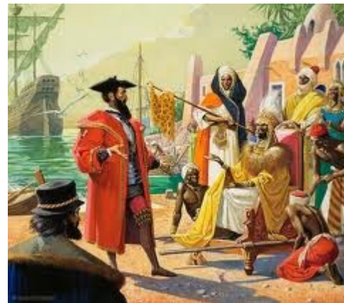
Vasco de Gama en Inde