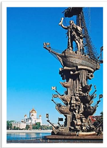
Statue de Pierre le Grand, tsar de Russie

La capitale de la Russie est Moscou. Les habitants parlent russe, mais il y a d'autres langues. Ils écrivent avec un alphabet cyrillique. La monnaie est le rouble russe. Il y a deux saisons : l'été et l'hiver. Les températures sont très basses en hiver.