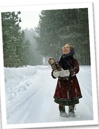
Fillette dans la neige

La capitale de la Russie est Moscou. Les habitants parlent russe, mais il y a d'autres langues. Ils écrivent avec un alphabet cyrillique. La monnaie est le rouble russe. Il y a deux saisons : l'été et l'hiver. Les températures sont très basses en hiver.