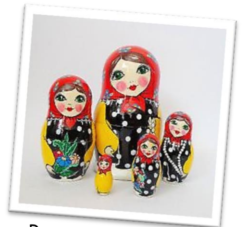
Des poupées gigognes