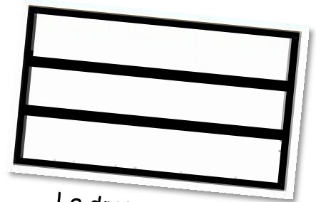
Le drapeau russe