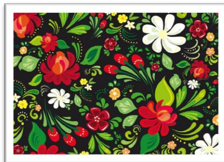
Motif traditionnel russe