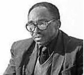
René Philombe (1930-2001)