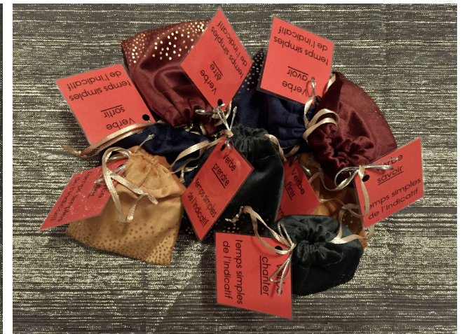
Les petits verbes rouges, temps simples de l'indicatif