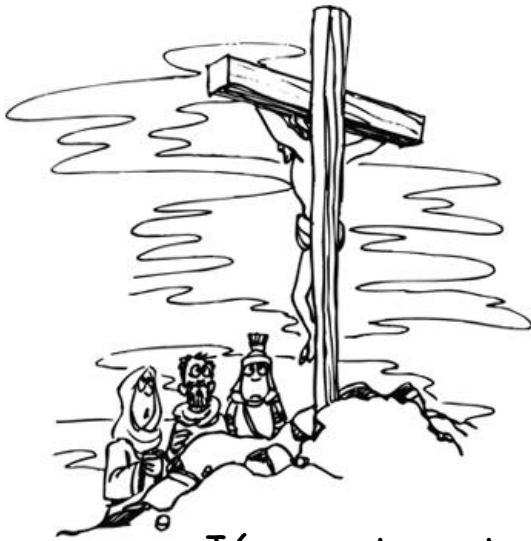
Jésus est mort