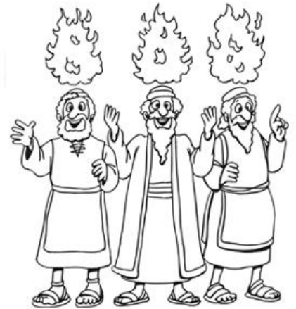
Le Saint-Esprit est venu