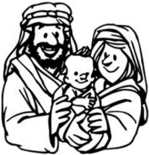
Jésus est venu