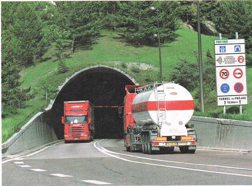
In « Géographie cycle 3, Magellan », HATIER 2012

Doc 3 : Le réseau autoroutier européen : tunnel de Fréjus dans les Alpes, 13 km, entre l'A43 (Provence-Alpes-Côte d'Azur en France) et l'A32 (Italie)