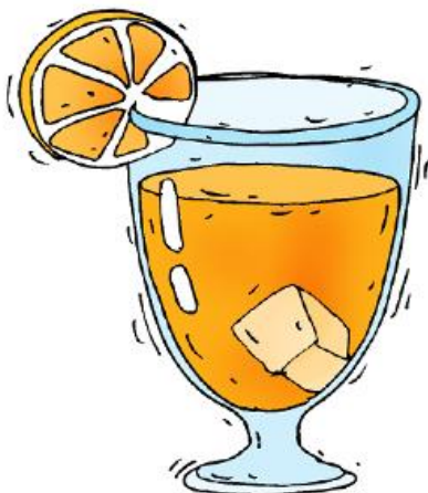
De l' orangeade