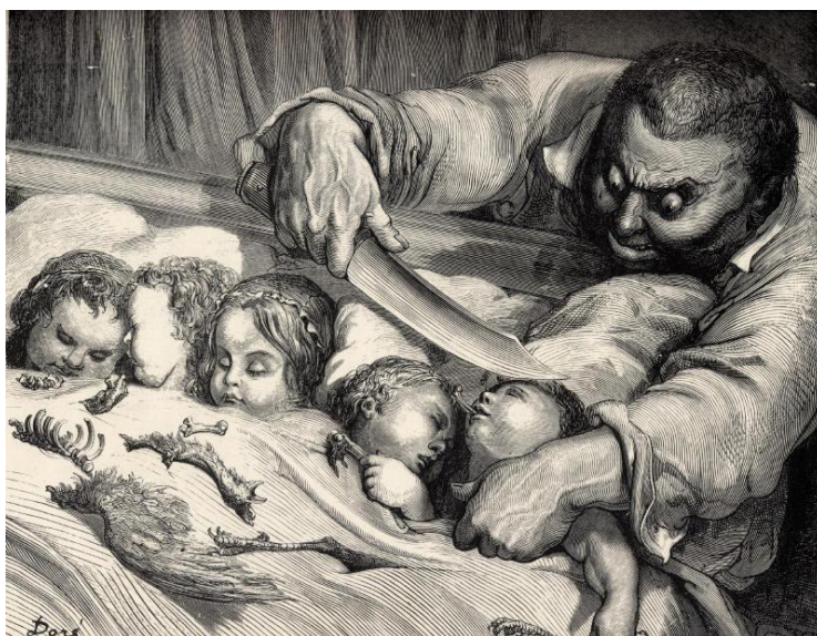
Illustration de Gustave Doré