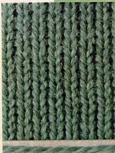
Photo à grandeur de la fibre utilisée