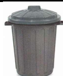
La poubelle ménagère