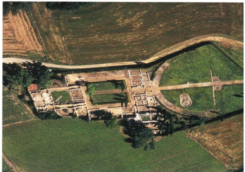
Diell 6. Villa Montmaurin (Haute-Garonne) savet e 1 añ kantved ha kemmet etre an 3 de hag ar 5 vet kantved.

Les transformations sont moins visibles. La majorité des Gaulois sont des agriculteurs habiles. Les Romains adoptent les techniques, le savoir-faire des Gaulois. Ils développent le commerce du vin. La campagne se couvre de grands domaines appelés villae . Grâce à la paix assurée par les armées romaines, la Gaule devient un pays riche et prospère.