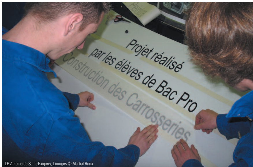
LP Antoine de Saint-Exupéry, Limoges