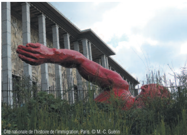
Cité nationale de l'histoire de l'immigration, Paris.