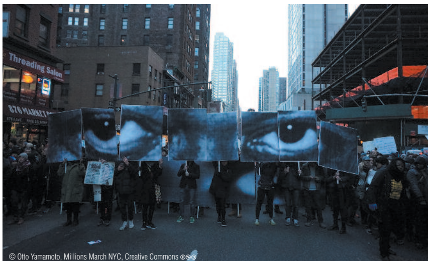
Millions March NYC