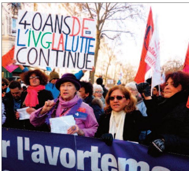
Manifestation du 17 janvier 2015.