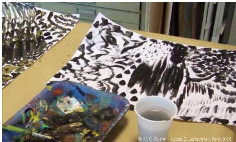
© M. C. Guérin - Lycée E. Lermontov, Paris 2008.