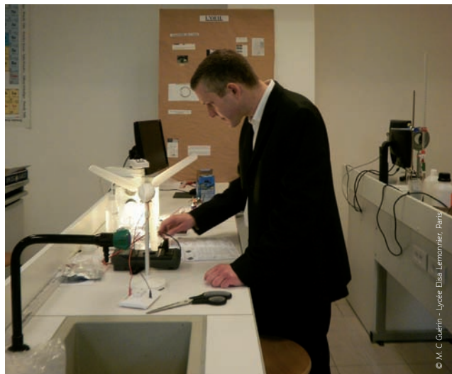
© M. C. Guérin - Lycée Elise Lemerrier, Paris