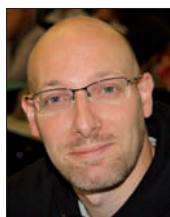
Titulaires et suppléant-es PLP élu-es en CAPN ]