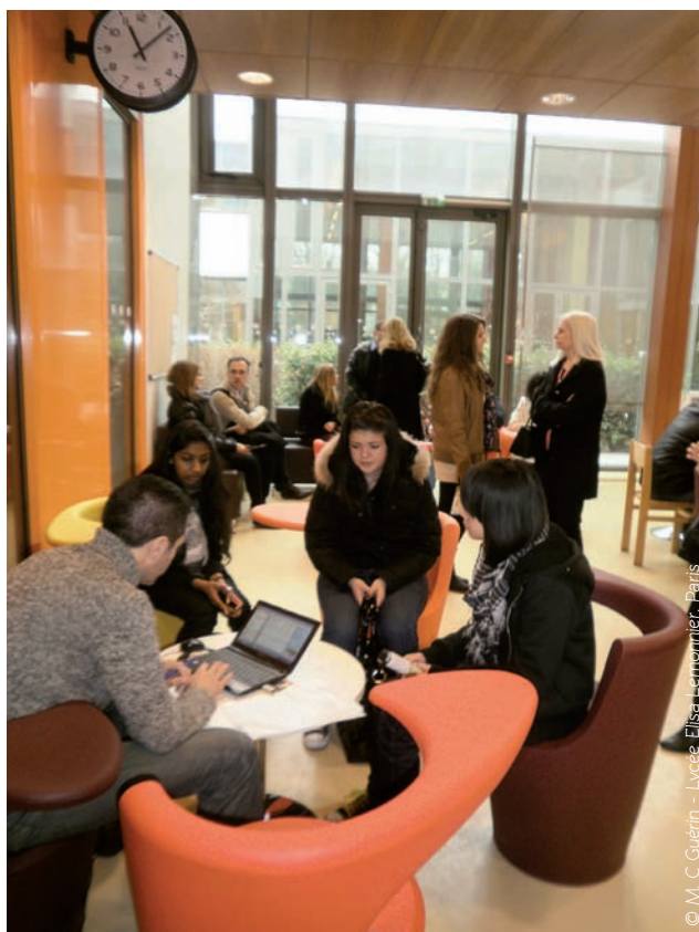
© M. C. Guérin - Lycée Elisa-Lemoinier, Paris

Des consultations ont été mises en place avec les organisations syndicales et des assises ont été organisées en octobre dernier. Parallèlement, la FSU a lancé une enquête (2) afin que la parole des personnels ne soit pas dévoyée.