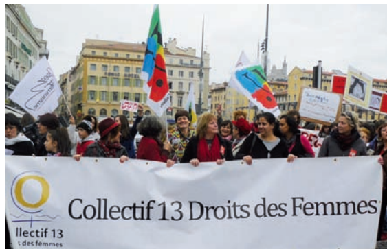
Manifestation en solidarité avec les femmes espagnoles. Marseille 2013.

syndicales et politiques françaises ont appelé à des manifestations dans toutes les régions le 1 er février, en même temps que la grande manifestation à Madrid.