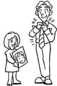
un ___ __