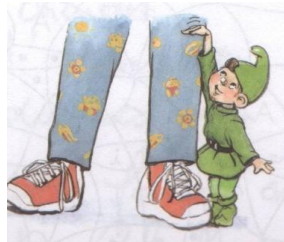
Il est ___tit.