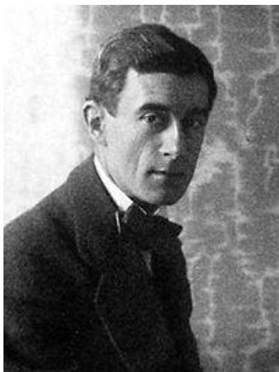
Maurice Ravel 1875 – 1937 Français