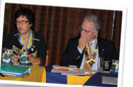
Réunion de travail dans une salle bien décorée