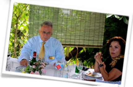
Déjeuner au Hai Phong avec quelques membres du club.