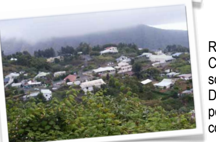
Rendez-vous à Dos d'Ane avec le CCAS de la Possession les Associations ARTADACA, Dos D'Ane Dynamique et Ti Fanal pour présenter l'opération Don de couvertures