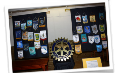
Et enfin cocktail dans un site magnifique le Domaine du Bois de Senteur