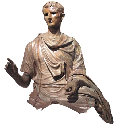
Statue équestre d'Auguste (fragment)