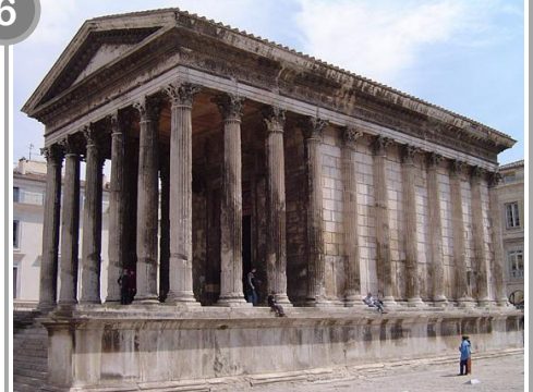
Maison carrée, Nîmes Temple dédié aux petits-fils d'Auguste