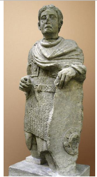
Statue d'un Gallo-Romain, découverte à Vachères, 1er siècle ap. J.-C.