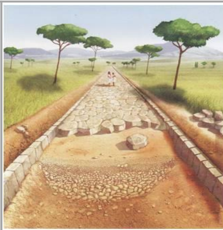
Coupe d'une voie romaine