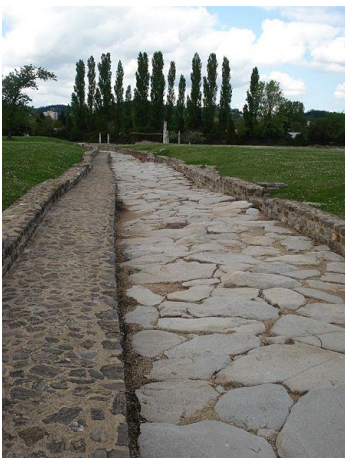
Voie romaine à Saint-Romain-en-Gal