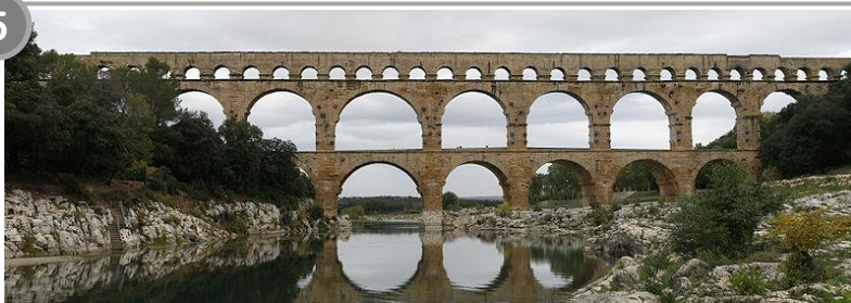
Le pont du Gard, 1 er siècle ap. J.-C.