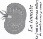
La tomate Le fruit est charnu et possède de nombreuses graines.

Les graines sont entourées d'une première peau, puis de la pulpe, et d'une peau externe.