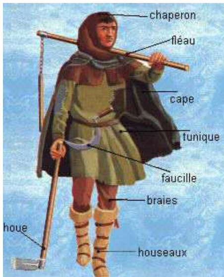
↑ Habillement d'un paysan du Moyen-âge.