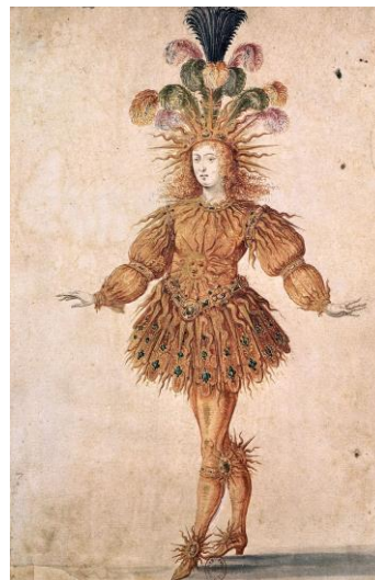
Louis XIV sur scène lors d'une comédie-ballet

Une comédie-ballet : Inventée par Molière en 1661, c'est une pièce de théâtre qui comporte des textes parlés et chantés ainsi que des danses. Exemple : En 1670, Molière a créé la comédie-ballet « Le Bourgeois gentilhomme ». La musique était de Lully.