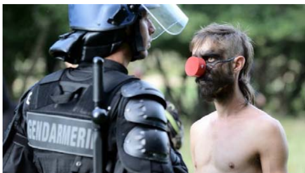
Militant zadiste face à un garde mobile - Sivens 2014

ZAD, c'est sous ce raccourci que sont désignés des individus, jeunes pour la plupart, qui s'opposent des projets soi disant « d'aménagement du territoire » : barrages, centres de loisirs, aéroport de Nantes.