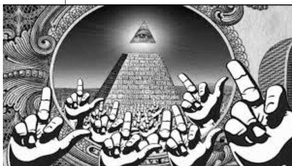
Les francs maçons et les juifs, cibles des antisystèmes

Alors messieurs les « antisystèmes » de quoi parlez vous ? A part des complots, des juifs, des francs maçons, des illuminati et autres maîtres secrets de nos