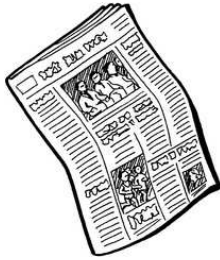
le journal le journal