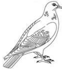
un pigeon un pigeon