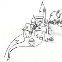
un village un village