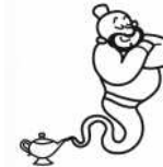
un génie un génie