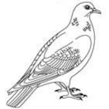
un pigeon un pigeon