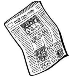
le journal le journal