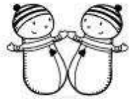
des jumeaux des jumeaux