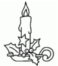
une bougie une bougie