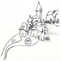
un village un village