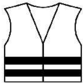
un gilet un gilet