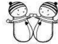
des jumeaux des jumeaux