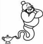
un génie un génie