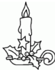
une bougie une bougie