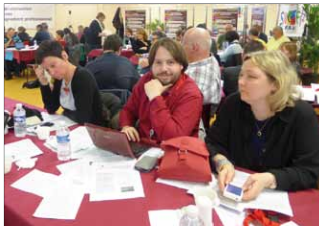
Délégation Créteil - Congrès Dinard.

Le ministère a enfin ouvert les discussions sur la question de l'ASH. Le 5 février, le SNUEP et la FSU ont assisté à la 1 ère réunion sur le devenir des SEGPA. Cette réunion de travail a permis au SNUEP-FSU de tracer la ligne rouge à ne pas franchir par le ministère et de faire préciser le cadre des prochains débats qui doivent se poursuivre jusqu'en juin 2014.