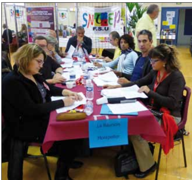
Délégations de la Réunion, Montpellier - Congrès Dinard.

Les questions spécifiques liées aux non-titulaires ont été abordées dans deux groupes de travail, lors desquels le SNUEP-FSU a rappelé ses demandes concernant les personnels en situation précaire. Il a rappelé aussi que les NT subissent des pressions importantes de la part des corps d'inspection et de direction. Ainsi la vacance sera définitivement abrogée.