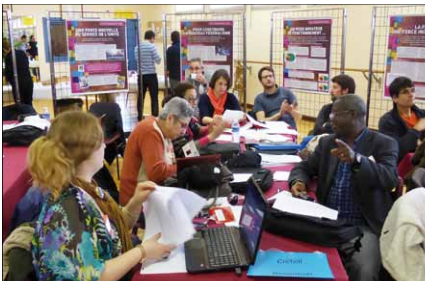
Délégations de Besançon, Créteil - Congrès Dinard.

Dans l'article 2, le ministère réaffirme le maximum horaire de notre service d'enseignement fixé à 18 h hebdomadaire. Néanmoins nous pouvons noter