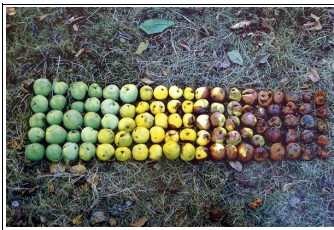
Nils Udo (ALL)