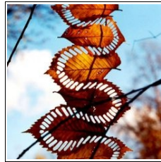
Andy Goldsworthy (GB)