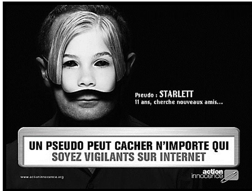
Campagne de sensibilisation aux dangers du Net.

Que peux-tu dire de l'affiche d'action innocence ci-dessus ?