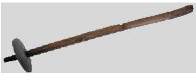
Doc B : une fuseïole - site du lac de Paladru

On a retrouvé sur le site des éléments que l'eau a conservé, comme des fuseaux, des peignes à tisser, des pelotes de fil et des fragments de tissu. On a également retrouvé des outils en pierre (haches, silex, racloirs...) ainsi que des récipients en terre cuite (vases, vaisselle...).