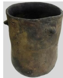
Doc E : une poterie - site du lac de Paladru