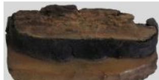
Doc C : un couteau à moissonner - site du lac de Paladru