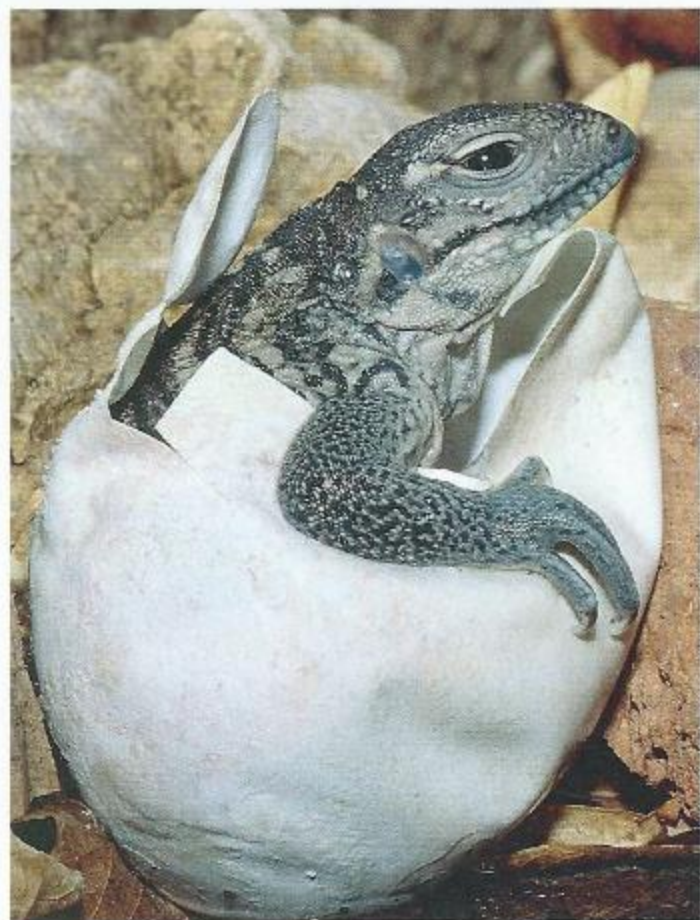
Document 1 : Un lézard.