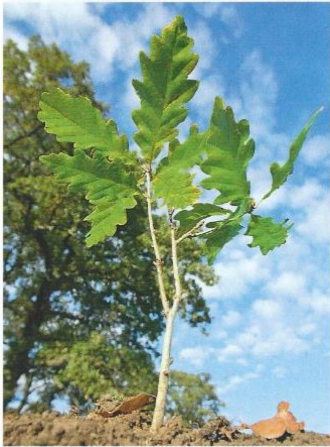
Document 3 : Un jeune chêne.