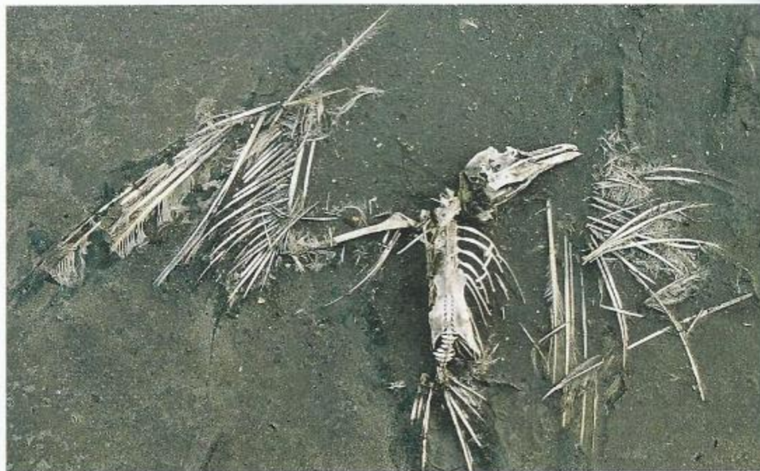
Document 2 : Un oiseau mort.