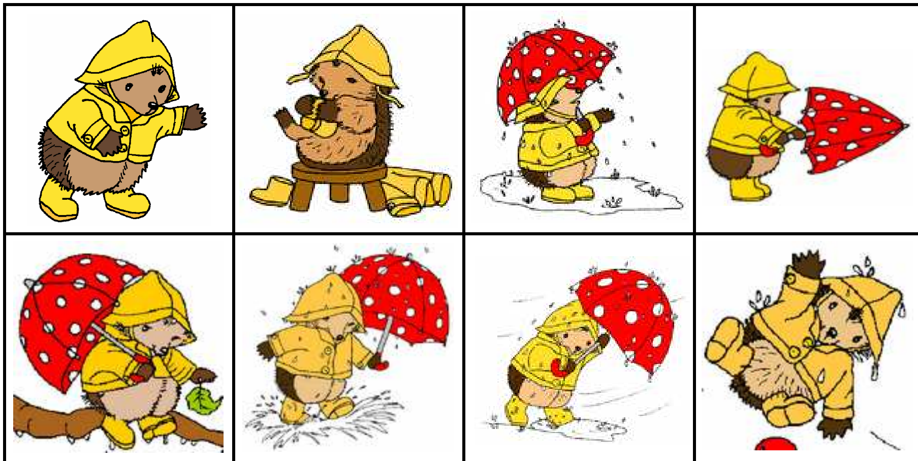
Planche à imprimer deux fois