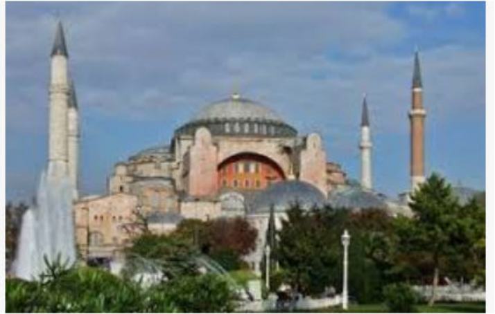
Sainte-Sophie (Constantinople) - Vikidia, l'encyclo...

D'après Procope de Césarée, * Livre des édifices, VI e siècle.