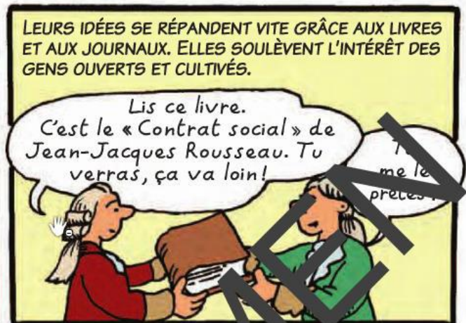
L'opposition des philosophes à l'absolutisme