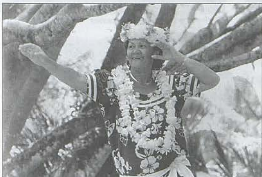
Une journée sous le signe du dialogue et de l'imagination avec le défilé de "200 ans de costume".