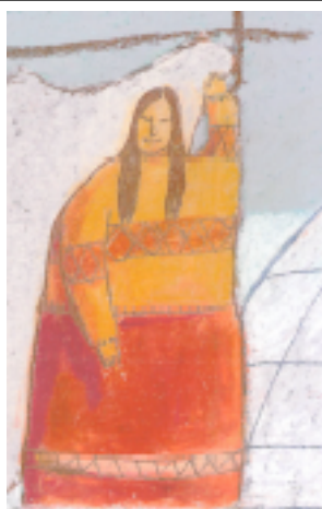
voisine Grand-Ma Kautahuk