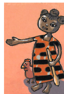
Fatou rivière crocodiles