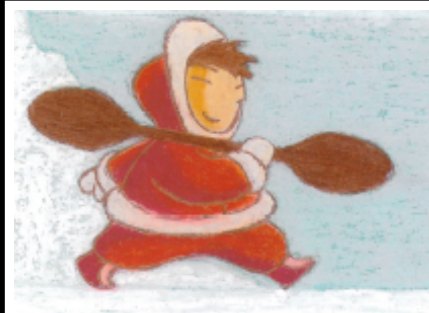
Kautahuk eskimo voyage