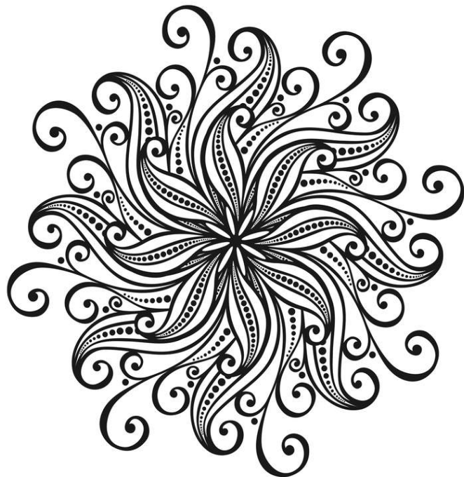
Symétrie Niveau 1

Voici un message codé. Pour le déchiffrer, écris dans notre numération à quoi correspond chaque nombre, puis remplace chaque nombre obtenu par la lettre qui correspond.