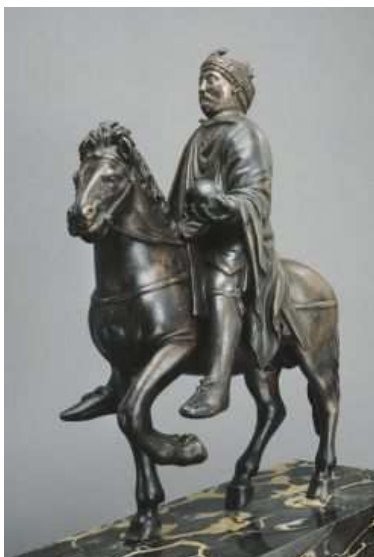
← Statue équestre* de Charlemagne bronze autrefois doré. première moitié du 9 ème siècle (Musée du Louvre)

Son fils, Pépin le bref, chasse le dernier roi fainéant. Le fils de pépin le bref, Charles, que l'on appelle Charlemagne (= Charles le grand en latin) devient roi en 771.