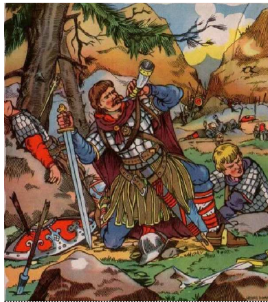
↑ Roland à Roncevaux. Illustration manuel scolaire 1950