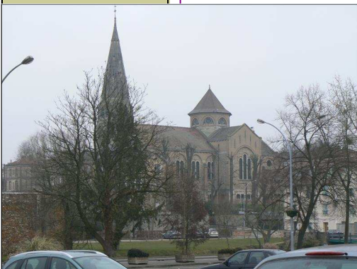
Eglise de Coulommiers (ci-dessus)

dre en direction de la voie ferrée—10 - Emprunter à droite la RD 934 sur quelques centaines de mètres, puis empruntez la première route à gauche au niveau du carrefour à feux tricolores —2 - Revenez par la petite route et le chemin jusqu'à votre point de départ.