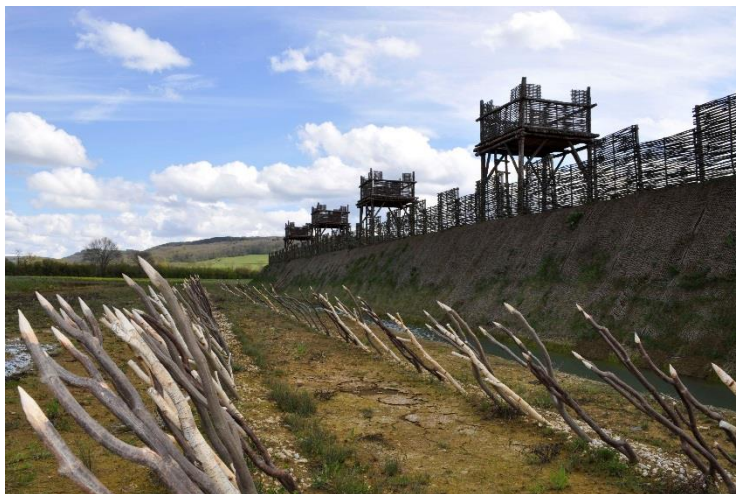
reconstitution des fortifications d'Alésia au musée-parc.

Vercingétorix convoque l'assemblée. Il déclare que cette guerre avait pour but la liberté de tous. Mais puisqu'il est impossible de vaincre, il accepte de mourir ou de se livrer aux Romains. On envoie des messagers à César. Celui-ci ordonne qu'on lui remette les armes et les chefs des peuples gaulois. On lui livre Vercingétorix, les Gaulois jettent leurs armes à ses pieds.