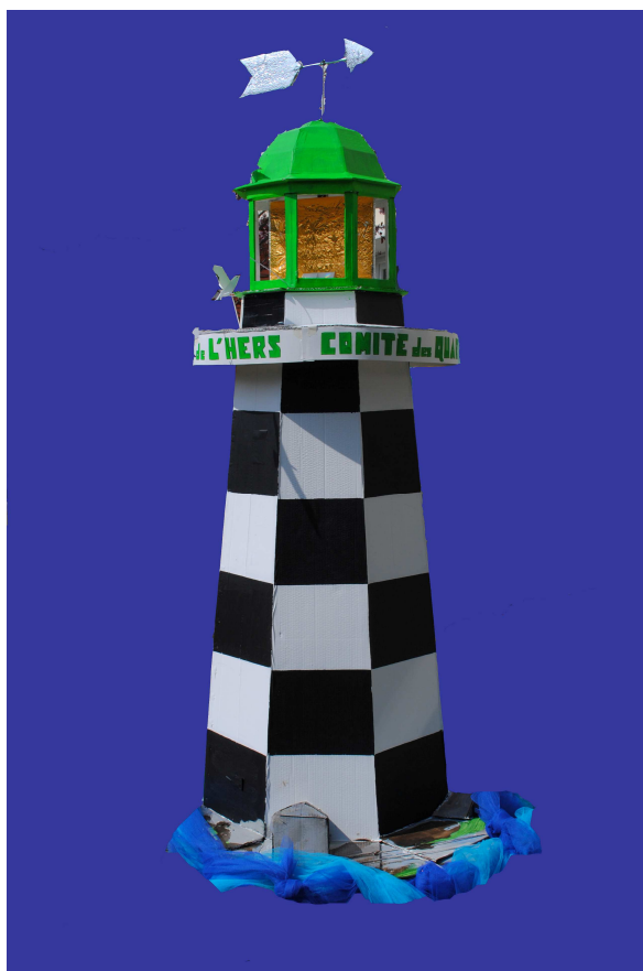
Phare réalisé par des bénévoles du comité de quartier pour le carnaval 2016